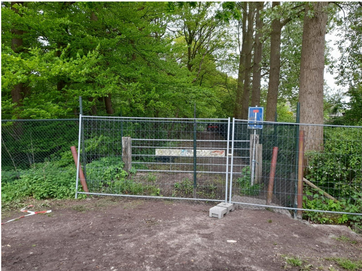
Figuur 1: huidige situatie gezien van het Reepad